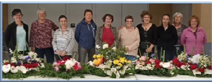
20 mai 2023 : confection des gerbes pour la cérémonie du 21 mai

Au delà de son implication, je tiens ici à remercier Mme PINCHELIMOUROUX pour son extrême gentillesse .